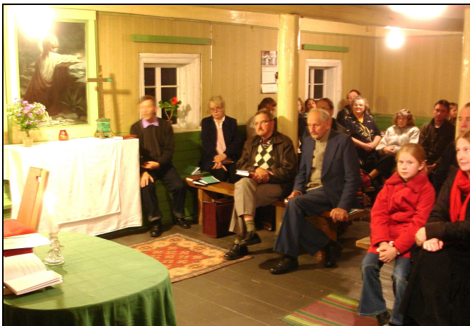
Laulu- ja palvetund Pühalepa palvemajas.