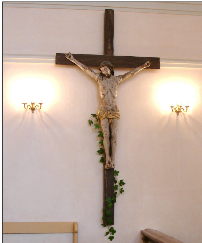
Rapla kiriku krutsifiks.

Et seda plaani piisavalt selgesti meile kirjeldada, on Jumal lisaks prohvetite kuulutamisele andnud meile Iisraeli rahva ajaloo abil üksikasjaliku pildi ka Messia päästetööst. Nii, nagu Mooses Jumala imetegude abil viis rahva orjusest vabaks omale maale, nii vabastab Jeesus, Jumala Poeg meid patusest elust ja viib meid oma taevariiki.